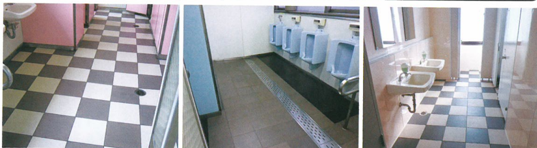
壁材や床材そのものに消臭殺菌能力を持たせる「MaSSCシールド」の導入実例(北九州モノレール・平和通駅)。この他、宮崎大学農学部の豚舎などでも実用化が進んでいる