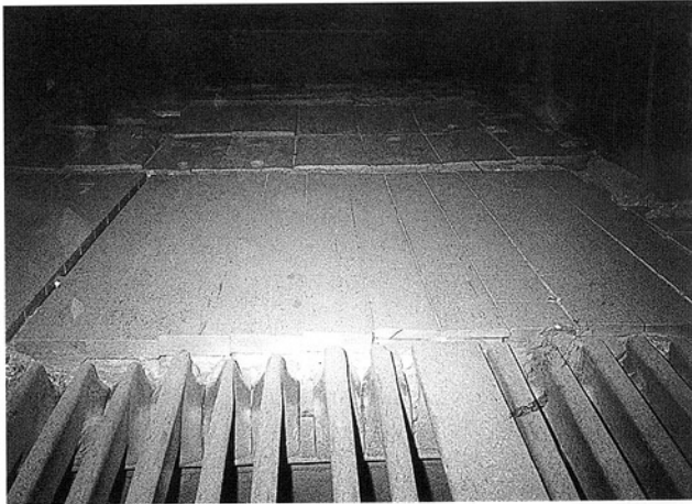
図-5 盲板シュートライナー

コークスの盲板シュートライナーにESTライナーを適用した例で、本ライナーは約300℃の原料（コークス）が常時通過しており、著しいアブレーション・摩耗雰囲気において使用されている。特に耐摩耗性を重視して、セラミックス（Al 2 O 3 系）の適用もされている箇所である。このような環境下へESTライナーを使用した結果、セラミックスで問題となった、剥離、脱落等の発生もなく、又、耐摩耗性についても、従来材であるセラミックスとほぼ同様な耐摩耗性を示し、総合的には約1.5～3倍の耐用を示している。