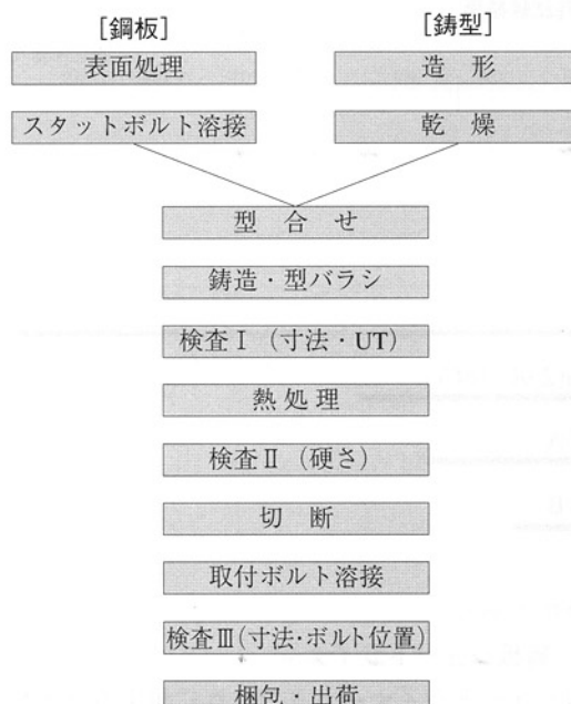
図-1 ESTライナー製造工程

「ESTライナー」の製造工程を図-1に示す。鑄造方法として、当社では新たに考案した特殊鑄造方式（クイクスプレッド方式）を採用し、大型サイズ（900mm×1800mm×30mm）の複合ライナーを製造している。製品構造の特長は、18mm厚の高クロム鑄鉄層と12mm厚の鋼板（SS400）を溶融接合させた2重構造である。又近年では、軽量薄物ライナーのニーズもあり、トータル厚み25mmのライナー材の製造も可能となっている。